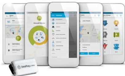
App-Ansichten von „Volkswagen Connect“ mit „DataPlug“

Wolfsburg (D) – Wegweisende Innovation für Besitzer älterer Volkswagen Modelle: Ein sogenannter „DataPlug“ kann im Zusammenspiel mit der neuen App „Volkswagen Connect“ fast jeden Volkswagen in ein modernes „Connected Car“ verwandeln. Ob informativ oder spielerisch – die App bietet für jeden Volkswagen Kunden viele praktische Features. Dazu nutzt ein nur zwei mal zwei mal fünf Zentimeter großes Bauteil die in jedem Fahrzeug vorhandene OBD2-Schnittstelle. Es ist leicht zu installieren und übermittelt, sofern der Nutzer dies erlaubt, die ausgelesenen Daten per Bluetooth an ein gekoppeltes Smartphone und die „Volkswagen Connect“-App. Die für Android und iOS erhältliche App startet aktuell in Deutschland mit zahlreichen Funktionen. Ab Baujahr 2008 stehen damit für nahezu alle* Volkswagen Modelle digitale Dienste zur Verfügung, die bisher nur Fahrer von Neufahrzeugen mit Car-Net Angeboten kennen.