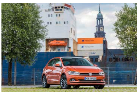
Der neue Polo in Hamburg