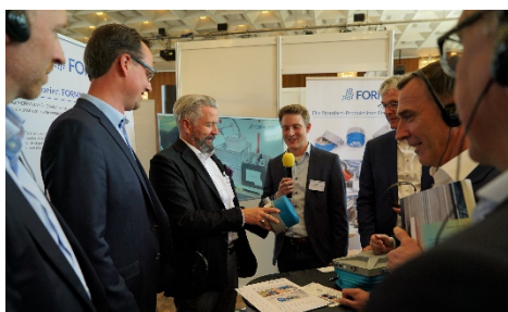
Vertreter des Volkswagen Konzerns sowie verschiedener Industrieunternehmen informierten sich über künftige digitale Lösungen in der Automobillogistik.

75 Firmen aus acht Ländern kamen zum „Innovative Logistics Solution Day“ in den CongressPark Wolfsburg. Darunter zehn besonders innovative Unternehmen, die im Rahmen eines Scouting-Verfahrens aus über 430 Bewerbungen ausgewählt wurden, und die ihre Logistiklösungen auf dem „Innovative Logistics Solution Day“ vorstellen durften. „Wir haben mit dem Institut für Produktionsmanagement in einem weltweiten Wettbewerb einige der innovativsten Anbieter der Automobillogistik ausgewählt“, sagte Thomas Zernechel, Leiter Volkswagen Konzernlogistik. Dass die digitale Zukunft der Automobillogistik sehr facettenreich ist, wurde in der Ausstellung deutlich.