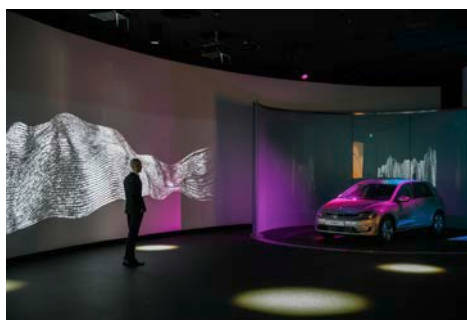
Die Fahrzeug-Auslieferung im Kundenturm e-Tower der Gläsernen Manufaktur Dresden wird zum digitalen Event.