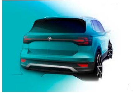
Heckpartie mit prägnantem Reflektorband

Beispiel Interieur: Die Designer tauchten bereits in einer frühen Entwicklungsphase in den großzügig geschnittenen Innenraum ein – virtuell via Augmented Reality. Sie testeten so die Ergonomie und das Ambiente, erlebten damit den T-Cross von morgen schon heute live, um ihn weiter zu perfektionieren. Parallel verschafften sie sich ein Gefühl dafür, wie es für die ersten Kunden sein wird, wenn schon bald deren Songs der Smartphone-Mediathek oder Streamingdienste via „Beats“-Soundsystem durch das Interieur des neuen SUV hallen.