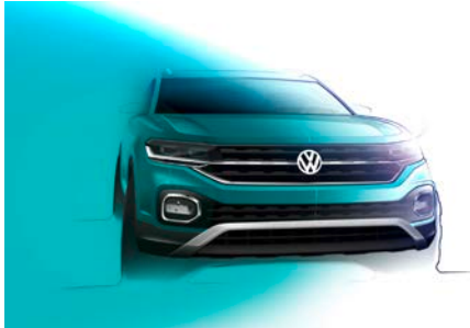
Charismatische Frontpartie des neuen T-Cross